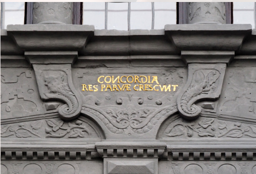
concordia res parvae crescunt (Kleine Dinge wachsen durch Eintracht. Sallust), Inschrift am Paderborner Rathaus

Gesellen alle, schließt den Reihen, / Daß wir die Glocke tau- fend weihen, Concordia soll ihr Name sein, Zur Eintracht, zu herzinnigem Vereine / Versammle sich die liebende Gemeine.