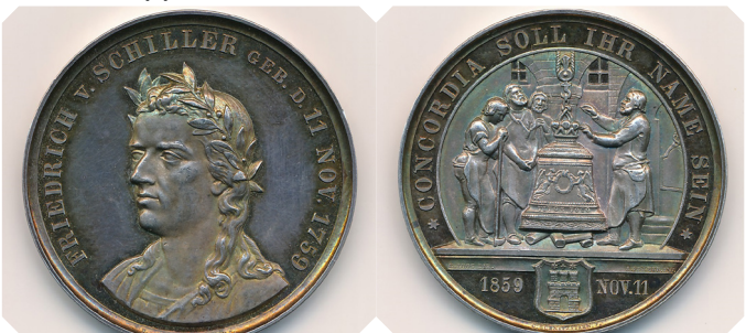
Hamburgische Gedenkmünze zu Schillers 100. Geburtstag 1859. Die Rückseite zeigt die Taufe der Glocke.

Nicht zuletzt mit diesem Text wurde Schiller zur Kultfigur der liberalen Opposition im 19. Jahrhundert. Wer sich sowohl gegen Fürstenwillkür als auch gegen die bloße Tyrannei einer unqualifizierten Mehrheit stellen wollte, fand in Schillers Ideal-Entwürfen den geistigen Überbau. In seiner Forderung nach politischer Mitbestimmung hob das Bürgertum Schiller auf den Schild, nicht zuletzt zum hundertsten Geburtstag des Dichters, der nach dem Scheitern der Revolution in eine Zeit des neuen Erstarkens der liberalen Opposition fiel.